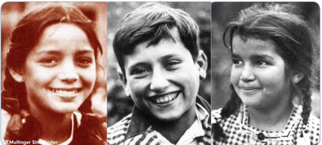
3 Mulfinger Sinti-Kinder