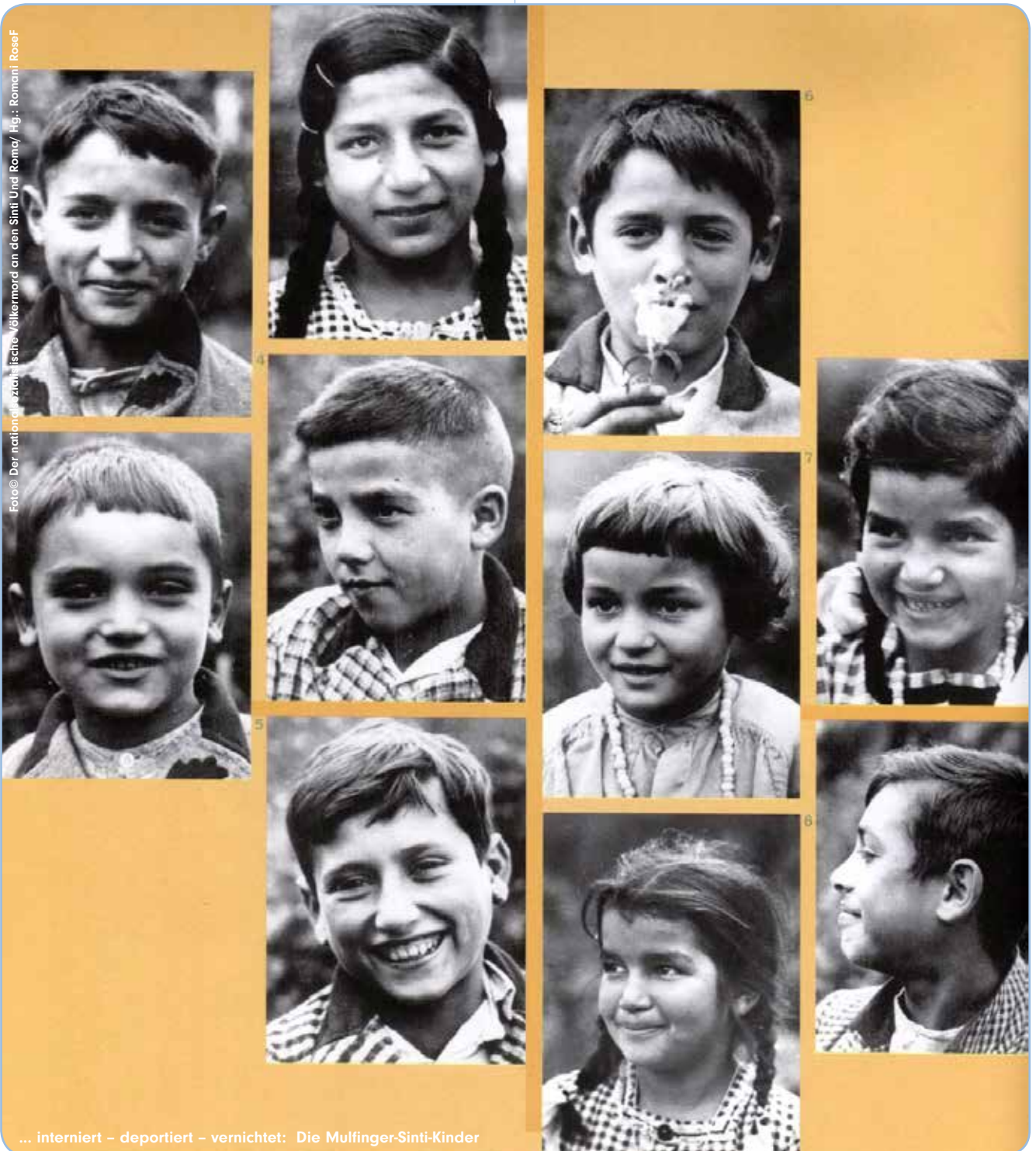
... interniert – deportiert – vernichtet: Die Mulfingener-Sinti-Kinder