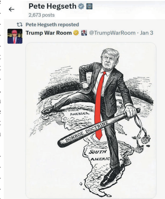
Donroe-Doktrin Nur wenige Stunden nach dem Angriff der US-Regierung auf Venezuela veröffentlichte ein offizieller Twitter-Account von Trump dieses Propagandabild, Trump War Room , (von US-Kriegsminister Pete Hegseth reposted).

Aber Trump prahlt ganz offen vom großen Geschäft mit dem venezolanischen Öl: „Unsere großen Ölkonzerne werden viele Milliarden investieren und die marode Infrastruktur reparieren. Dann werden wir Geld machen.“