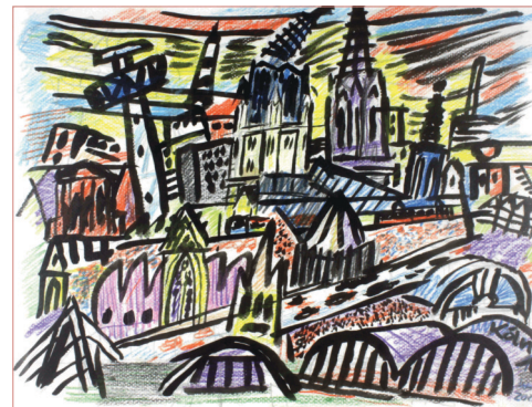
Walter Stehling, Köln, kubistisch, 2026

deutschen Städten und Regionen verglichen. Die Angebotsmieten lagen im vierten Quartal 2025 bei 4,5 Prozent über denen des Vorjahres, während sich die Inflation, die das statistische Bundesamt errechnet, mit 2,2 Prozent begnügte. Allein innerhalb der letzten drei Monate stiegen die Angebotsmieten um 1,0 Prozent.