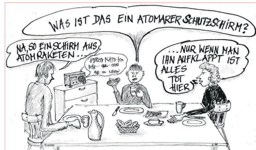
Felix Winter, Schutzschirm, 2024

Lösung: Zwangsverpflichtung und Rückgriff auf die rund 1,7 Millionen ehrenamtlichen Einsatzkräfte, inklusive Feuerwehr und Technischem Hilfswerk.