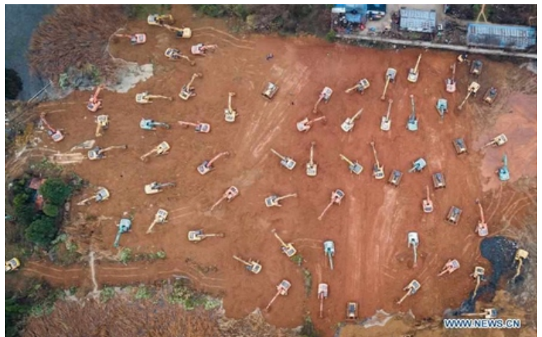
Bau des Krankenhauses Huoshenshan in Wuhan 2020 während der Corona-Pandemie.

China hat sich in den letzten Jahrzehnten in einem atemberaubenden Tempo vom Entwicklungsland zur weltweit führenden Industrienation entwickelt. Das Land setzt inzwischen Maßstäbe in der Entwicklung neuer Technologien. Von der UNO gewürdigt werden die Leistungen Chinas im Bereich Umwelt- und Klimaschutz und bei der Bekämpfung der Armut.